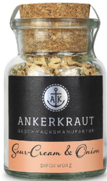
Ankerkraut "Sour-Cream & Onion", Dip-Gewürzmischung