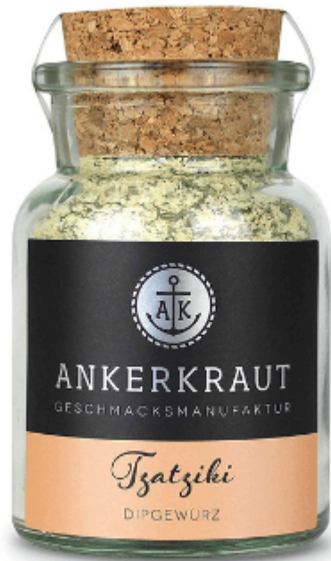
Ankerkraut Tzatziki, Dip-Gewürzmischung