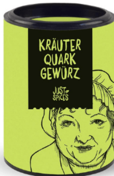
Just Spices Kräuter Quark Gewürz