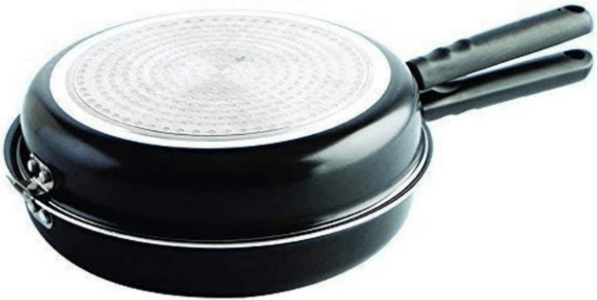
MGE – Omelette-Pfanne