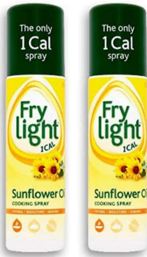
Frylight 1 kcal Spray