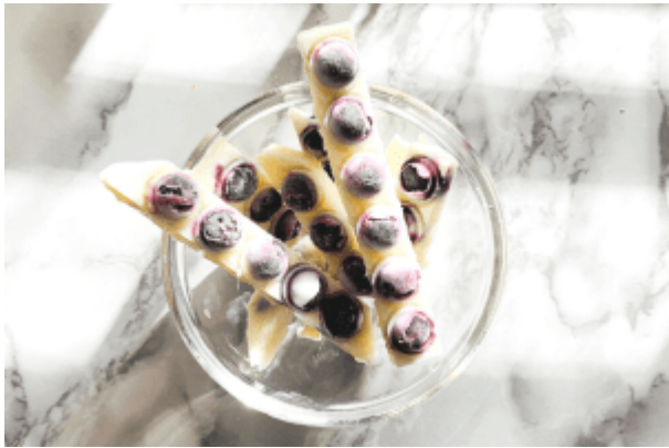
Frozen Joghurt Sticks